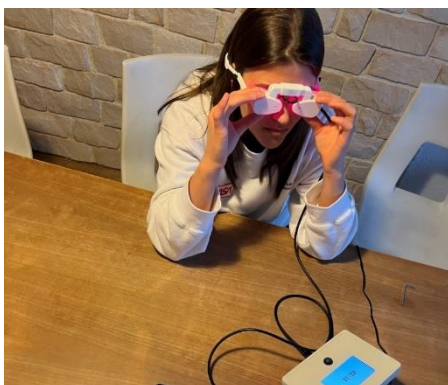
Abbildung 2: Das MACULIGHT Gerät im Einsatz.

Die positiven Ergebnisse der PBM sind bisher ausschließlich mit großen Geräten innerhalb von Kliniken/Praxen gezeigt worden. Mit MACULIGHT gibt es erstmals ein Gerät, das dieselbe Leistung wie die Großgeräte hat, jedoch klein und handlich ist und jeder Patient leicht zu Hause anwenden kann.