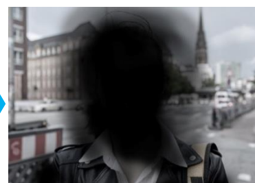
Symptome einer späten trockenen AMD